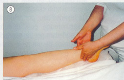
Movimento da bomba (joelho)