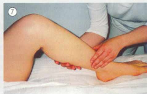
Movimento da bomba (coxa)