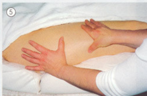
Técnica dos polegares