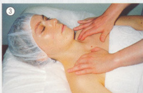
Bombear e reenviar