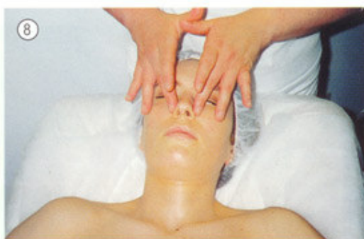
Círculos estacionários (nariz)