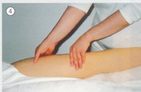
Movimento da bomba e da pá